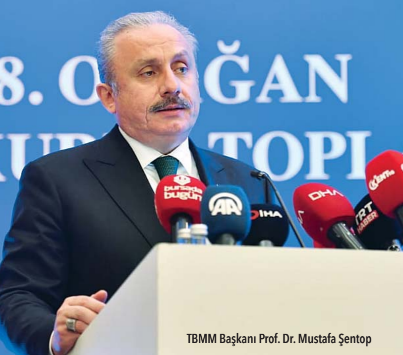
TBMM Başkanı Prof. Dr. Mustafa Şentop