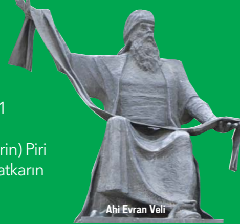
Ahi Evran Veli